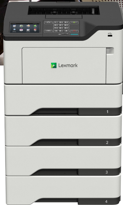
M3250 avec bacs en option